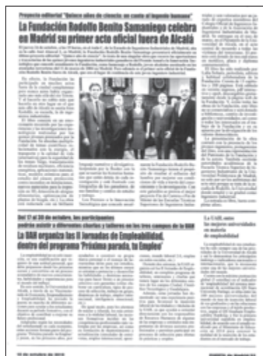
Puerta de Madrid, 18/10/2019