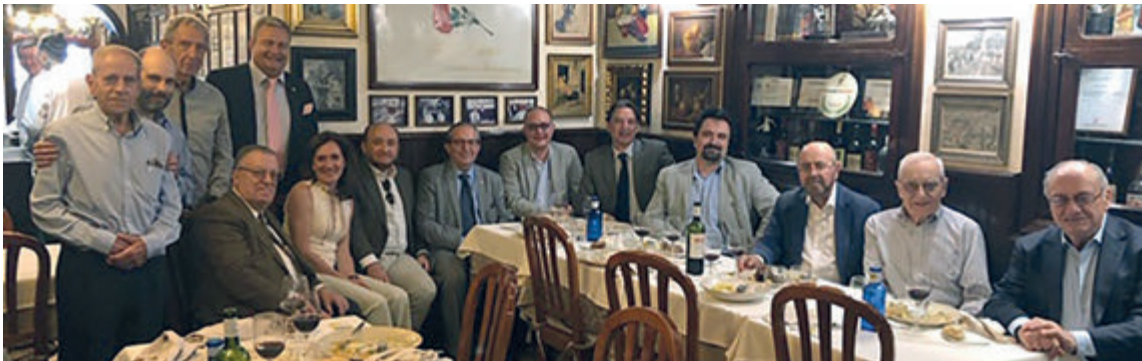
La fraternal colaboración con la Asociación y el Colegio de Ingenieros Industriales de Madrid alcanza ya tres lustros.