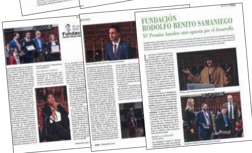
Revista TESLA - Primavera 2019