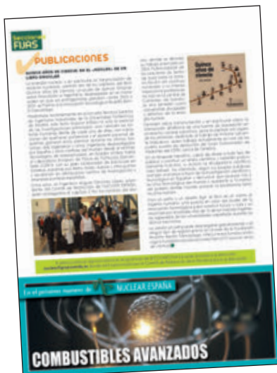
Revista Nuclear España, octubre 2019