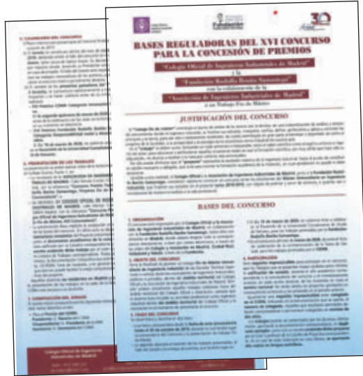
Revista TESLA - Primavera 2019