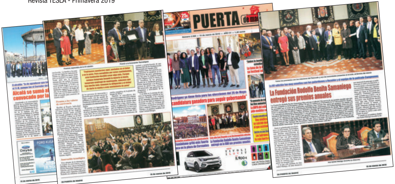
Puerta de Madrid - 15/03/2019