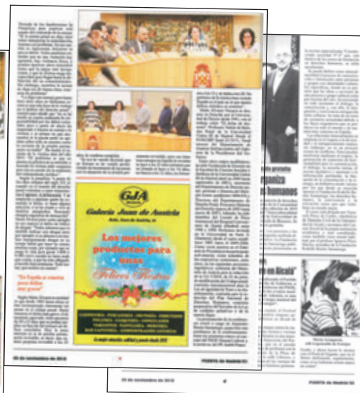
Puerta de Madrid, 08/11; 15/11 y 29/11 /2019