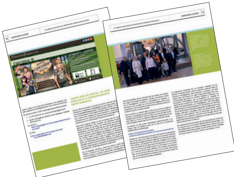
Revista Andaluzap Nº 22, diciembre de 2019