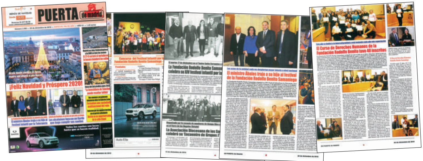
Puerta de Madrid, 13/12 y 20/12 de 2019