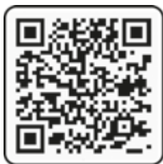
Presentación del libro Quince años de Ciencia (3 min: 37 s).