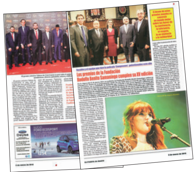
Puerta de Madrid - 08/03/2019