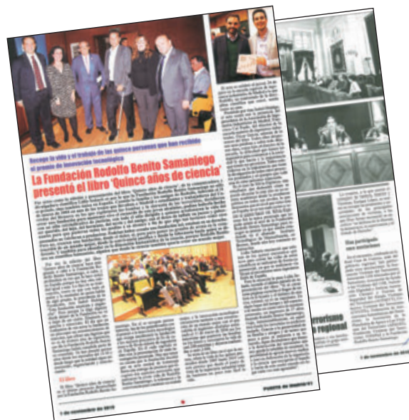
Puerta de Madrid, 01/11/2019