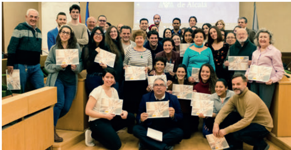
Nuestra ya tradicional «foto de familia» del curso anual de Derechos Humanos.