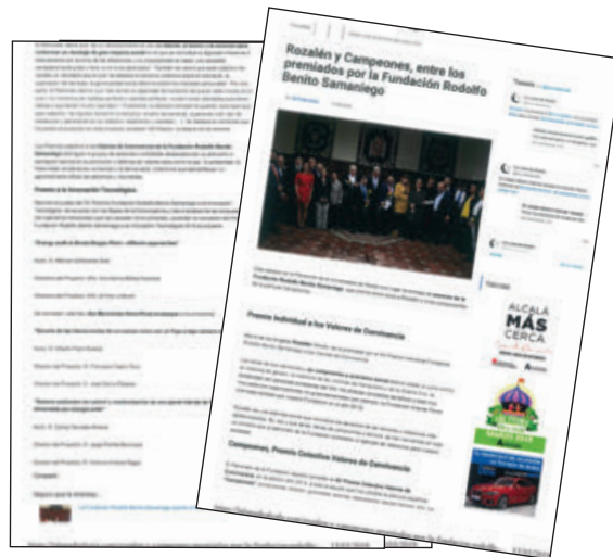
La Luna de Alcalá - 11/03/2019