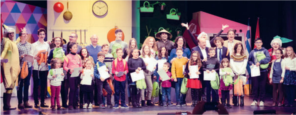
Dos momentos entrañables: los premiados con parte del patronato de la fundación y con los actores y actrices. Y luego, ya durante la obra musical Cantachef, con las verduras y frutas haciendo de las suyas...