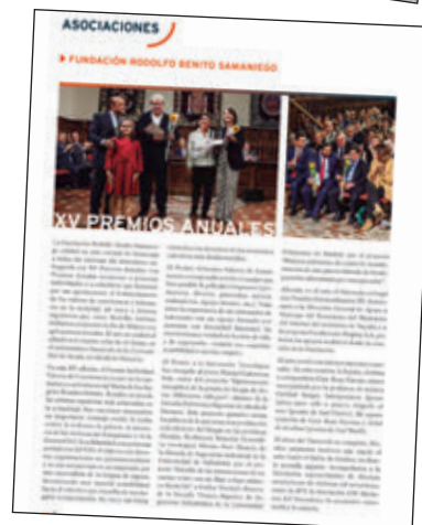
Revista Fundación Víctimas del Terrorismo Nº 66, marzo 2019