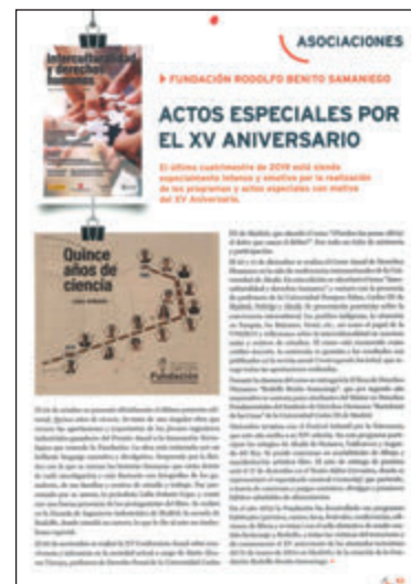
Revista Fundación Víctimas del Terrorismo Nº 69 - diciembre de 2019