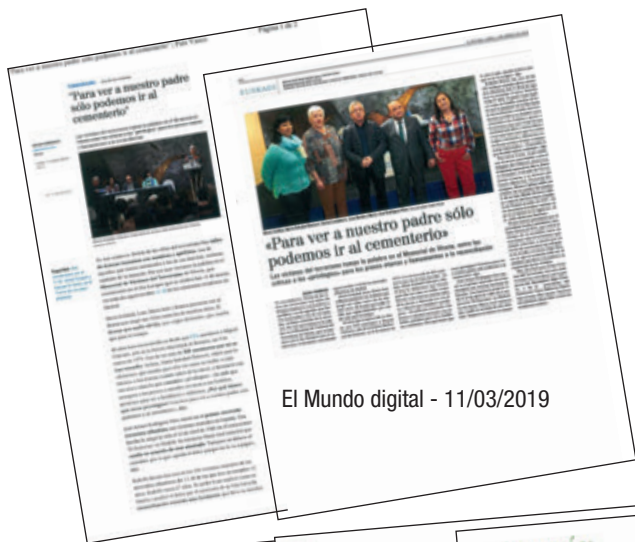
El Mundo digital - 11/03/2019