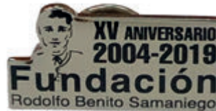
Pin y cartel Gala XV Aniversario

Además, en abril recibimos el pin XV Aniversario, que habíamos encargado con el logo específico de esta celebración en colores muy sobrios y una gota de resina que lo hace más perdurable. Igualmente, solicitamos y valoramos varias propuestas para el Cartel XV Aniversario, a cargo del diseñador Monchi Álvarez, quien ha sido el responsable de los principales diseños de la fundación a partir de 2014.