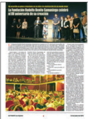
Puerta de Madrid - 24/05/ y 14/06/2019